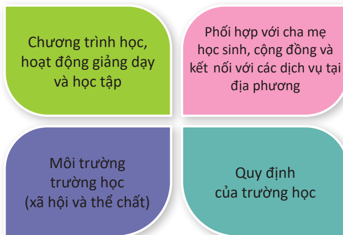
Hình 3: Mô hình trường học nâng cao sức khỏe toàn diện